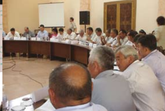
Круглый стол по обсуждению Закона о пастбищах (село Койташ, Кыргызстан 2007)