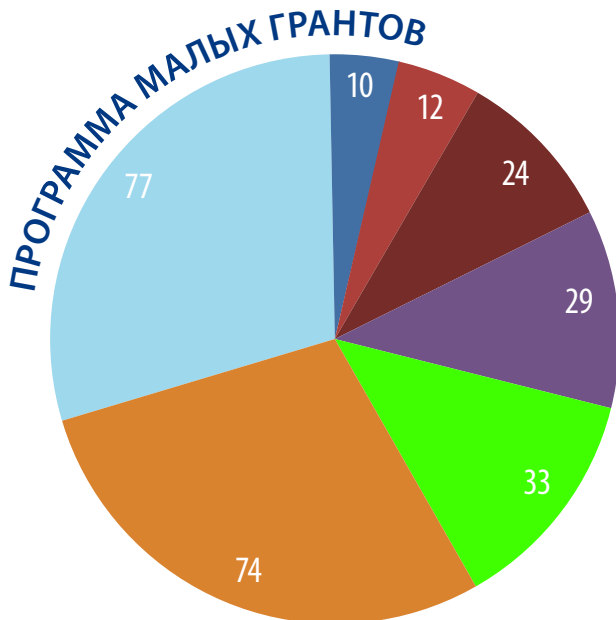
Количество малых грантов по видам деятельности в 2002-2007 г.г.