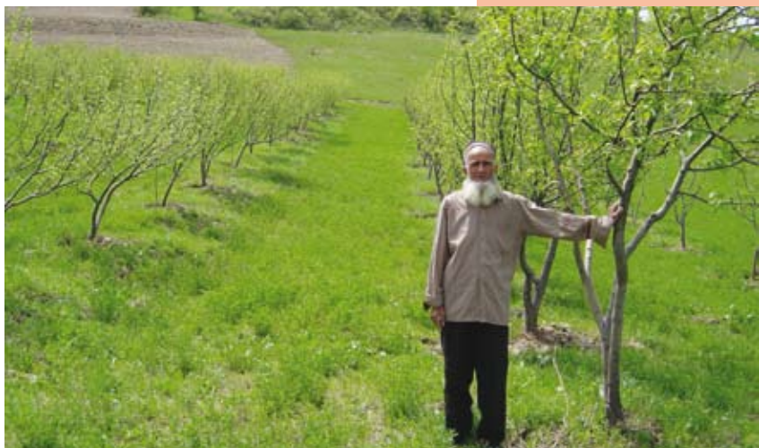
Посадка новых садов увеличивает возможности будущих доходов