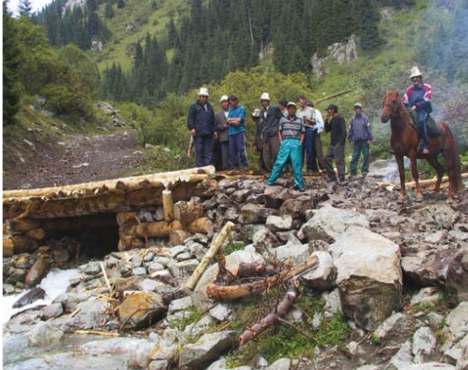
Восстановление мостов предоставляет сельчанам доступ к отдаленным пастбищам