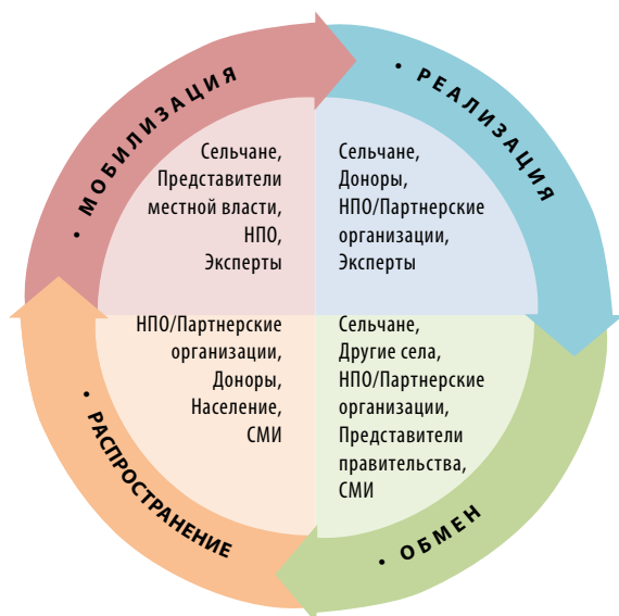
Подход CAMP из 4 шагов по развитию села

Активно вовлекаясь в процессы планирования, сельчане становятся более ответственными за реализацию мероприятий.